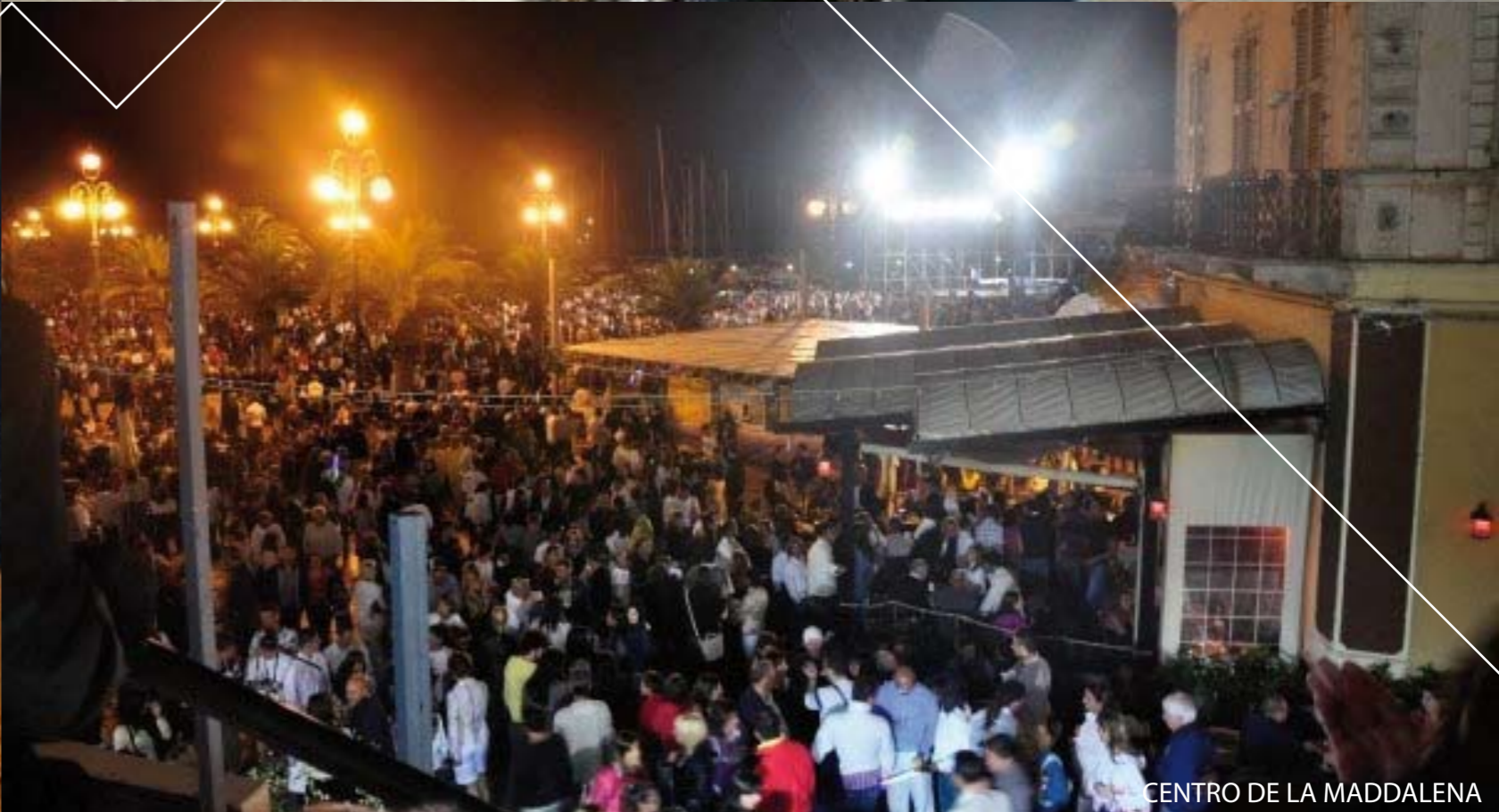
CENTRO DE LA MADDALENA