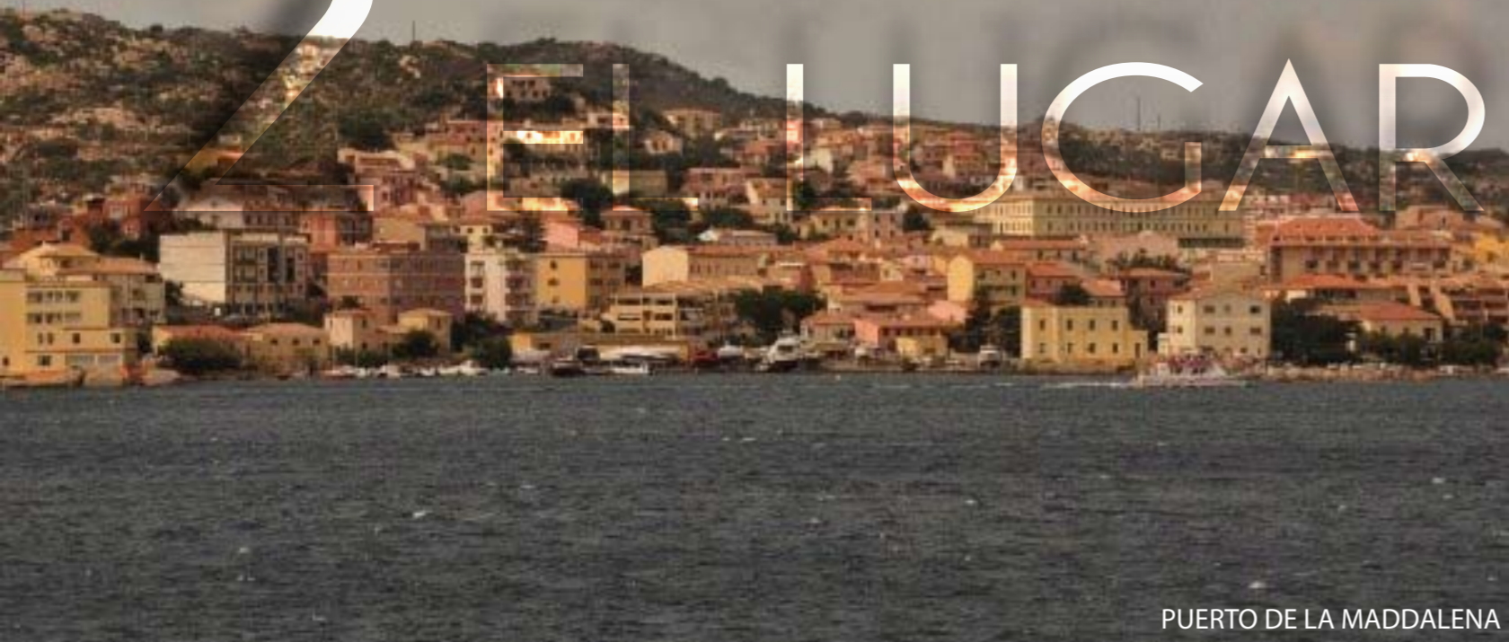
PUERTO DE LA MADDALENA