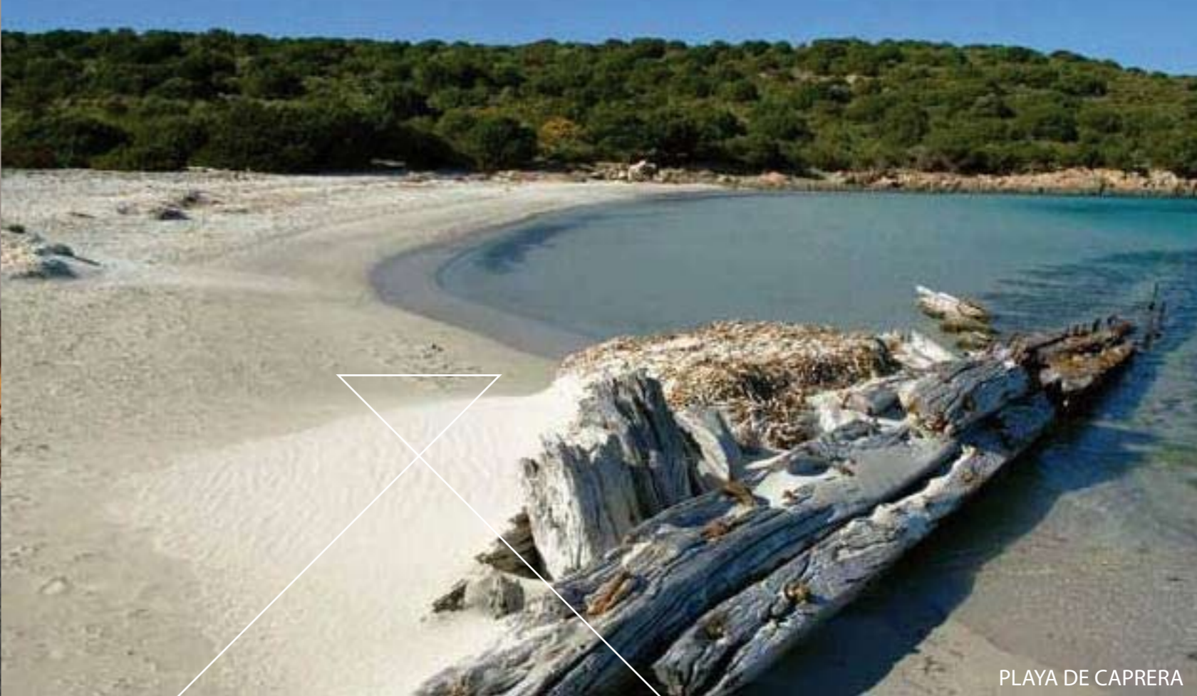
PLAYA DE CAPRERA